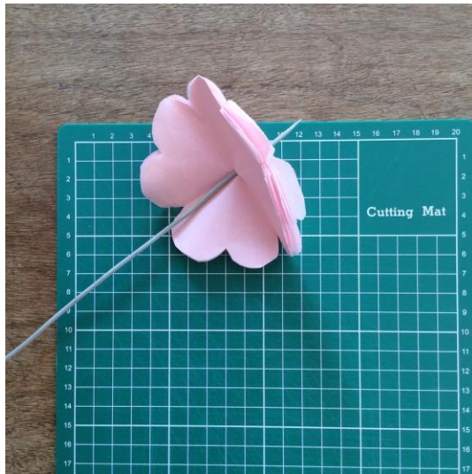
3. ÅBEN BLOMST. LAV ET HUL MED EN STIK