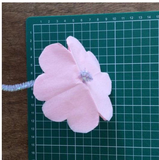
5. FOLDT TRÅD PÅ TOP OG PÅ BOTTOM AF BLOMSTRÅN